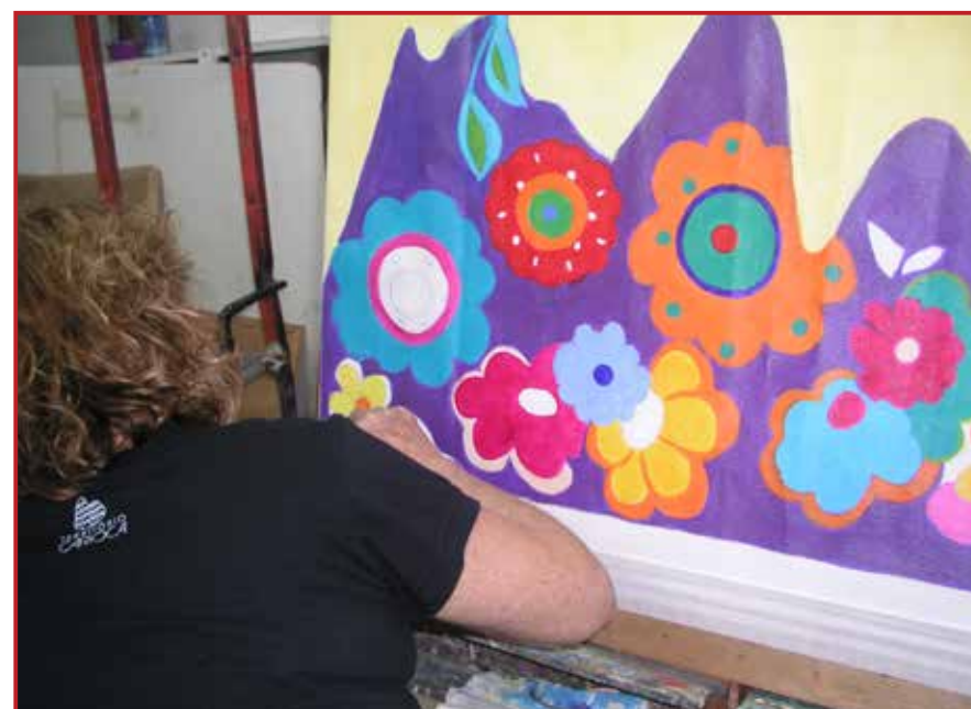
Alunas do ateliê do departamento de Cultura do Tijuca Tênis Clube

A atividade, além de despertar a imaginação, melhora a concentração e promove um bom equilíbrio mental diminuindo o estresse. Há pesquisas, inclusive, que mostram que colorir, desenhar e pintar estimulam a parte do cérebro relacionada ao sistema de recompensa. Ou seja, desperta o prazer, o alívio e a satisfação de harmonia consigo mesmo.